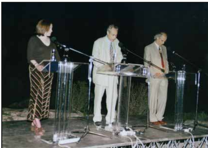
Η ποιήτρια Lavinia Greenlaw, ο Καθηγητής Χρήστος Γούδης και ο ηθοποιός Γιώργος Κιμούλης σε ένα στιγμιότυπο της βραδιάς "Ποίηση και Αστρονομία"